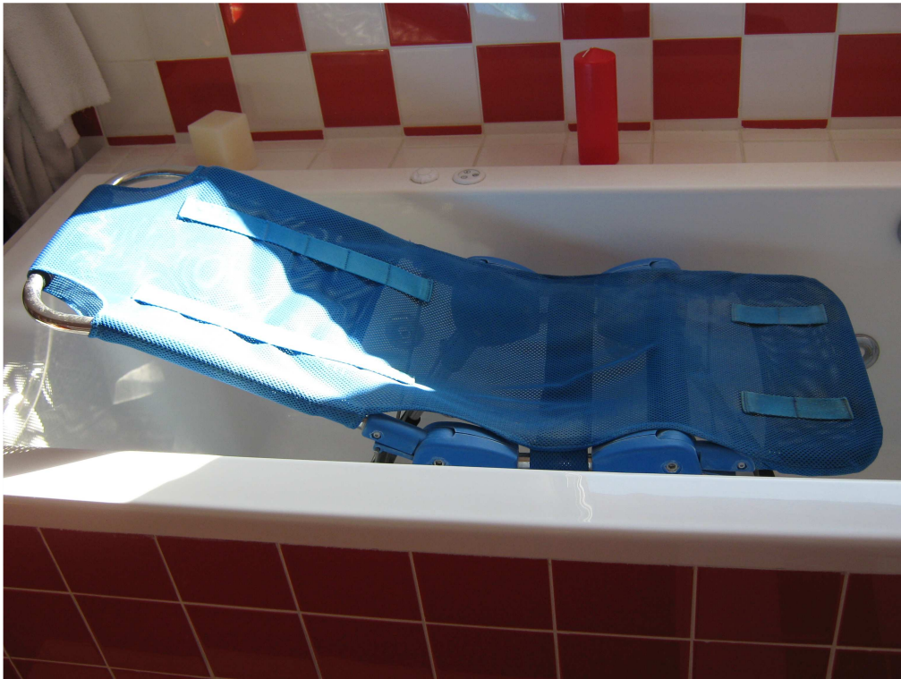
Siège de Bain