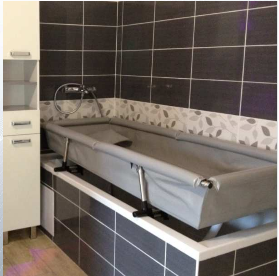
Lit douche mural