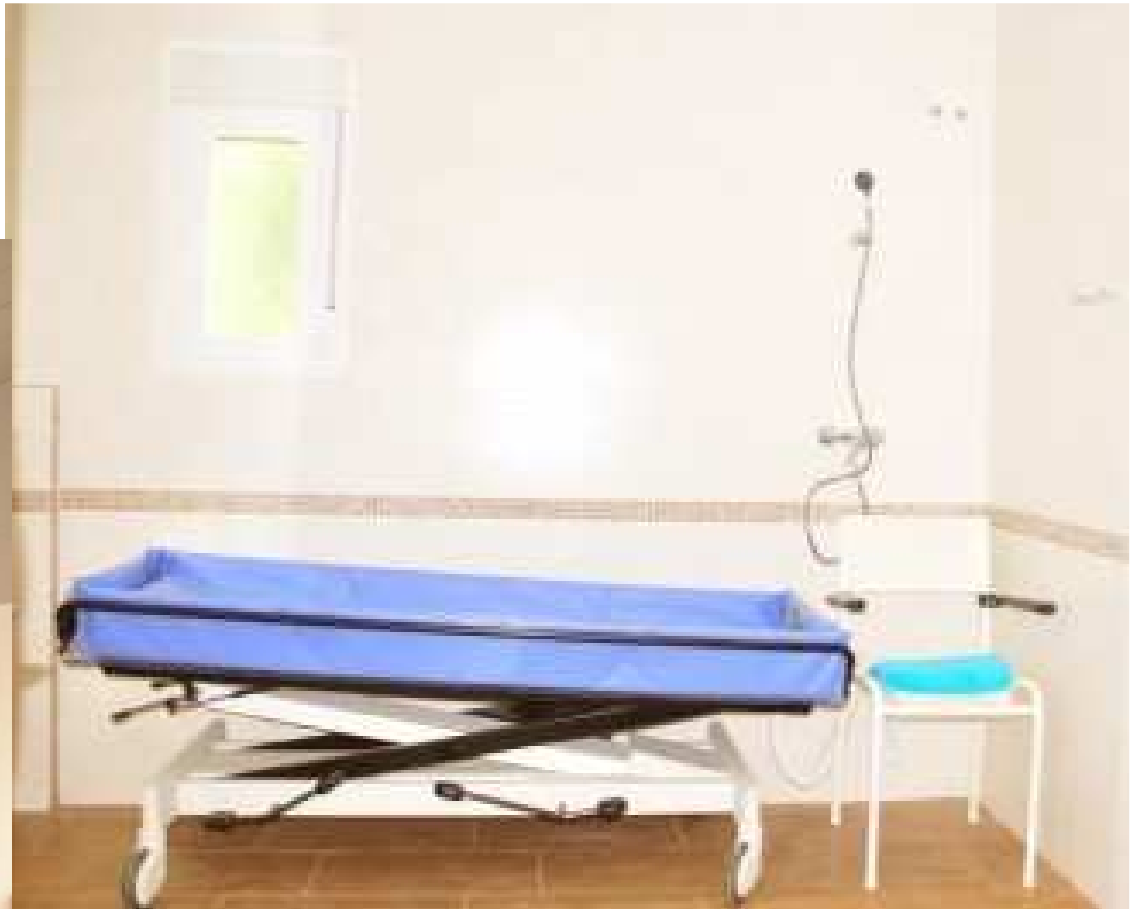
Charriot de douche