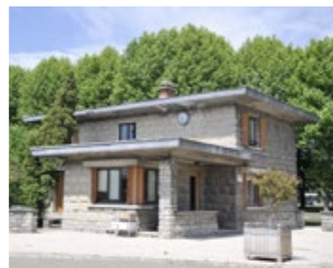
Incubateur de Bondy