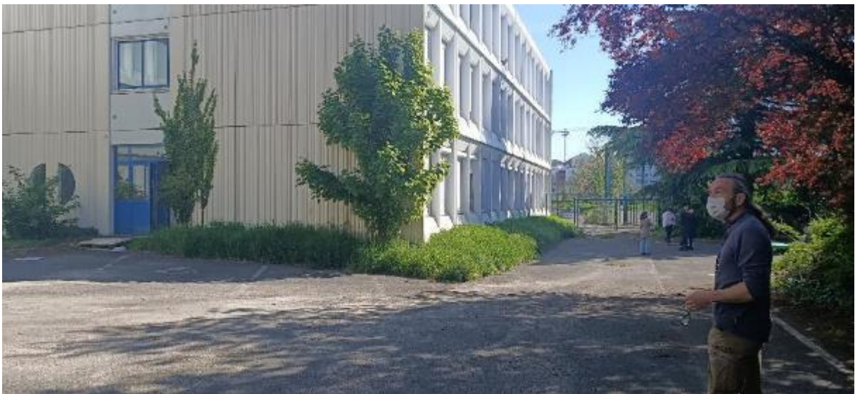
Aperçu d'une des trois autres parcelles

Disponibilité : rentrée scolaire 2021-2022