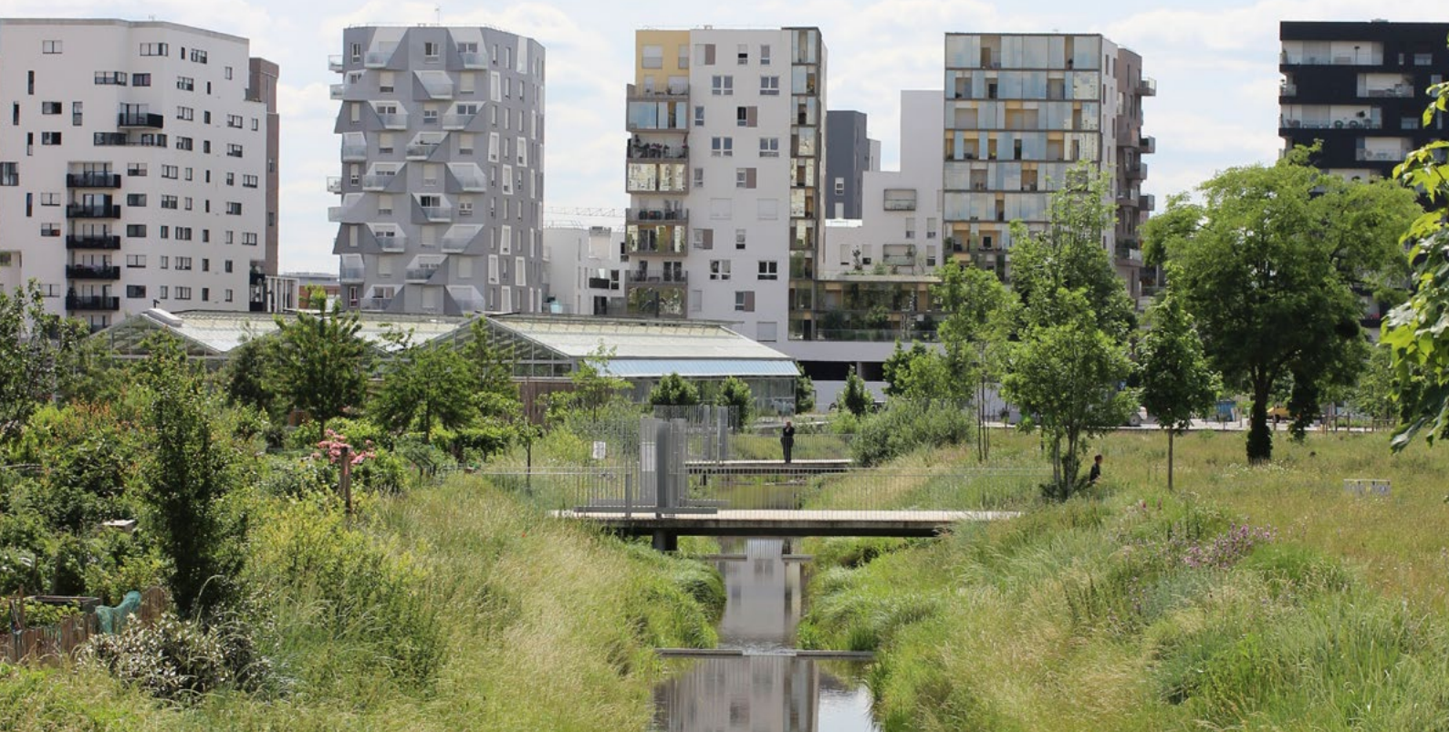
Parc de la Zac des Docks, Saint-Ouen