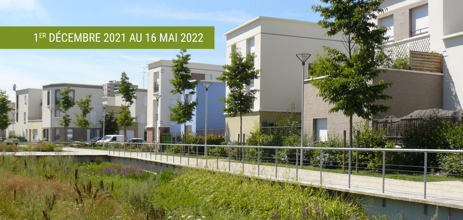
Quartier des 3 rivières à Stains - Noues avec passerelle (Crédit : Atelier de l'île)